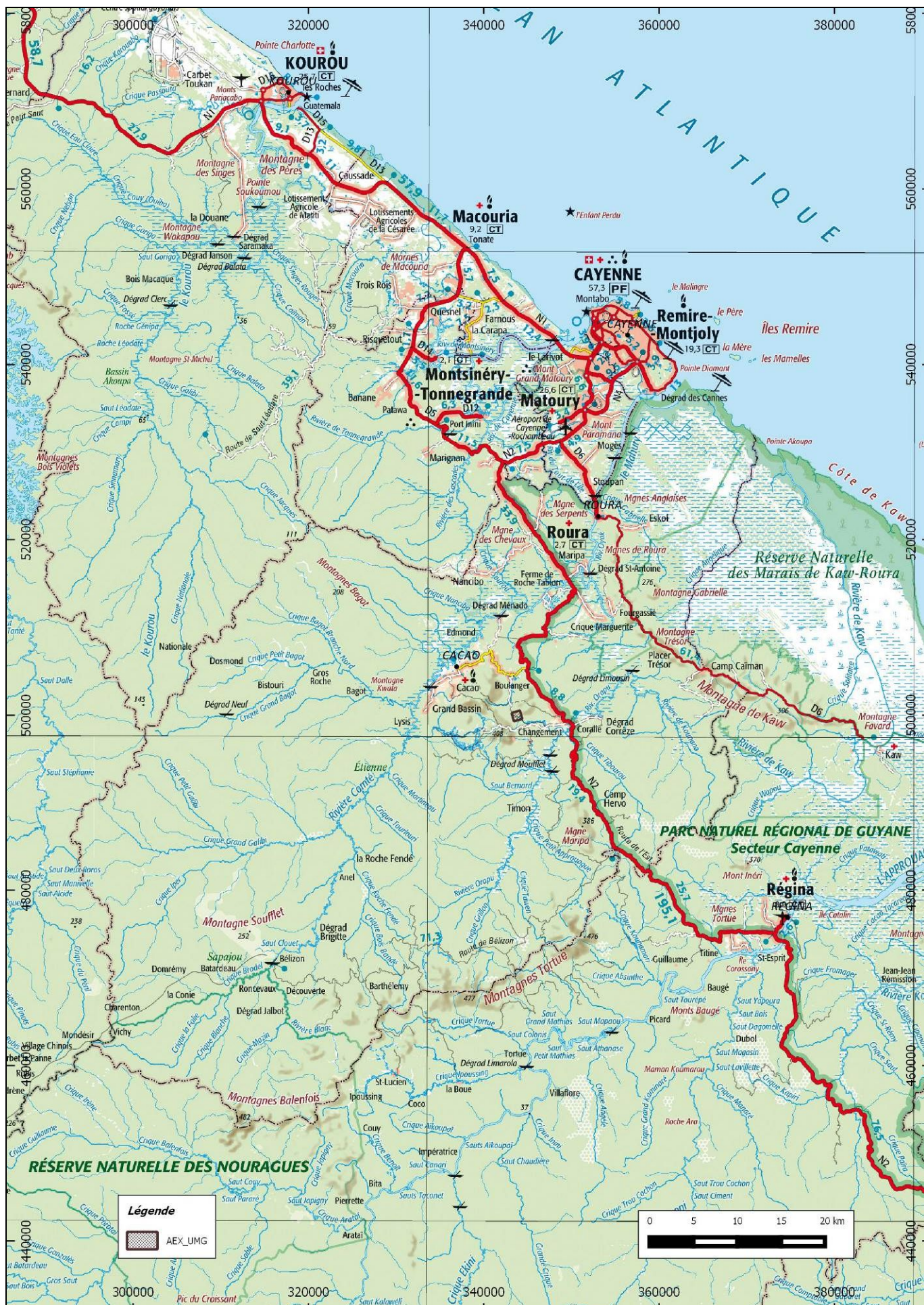
Carte de situation de l'AEX « crique Patagaï 1 » de la société UMG d'après la carte IGN au 1/500 000° en RGFG95 UTM22